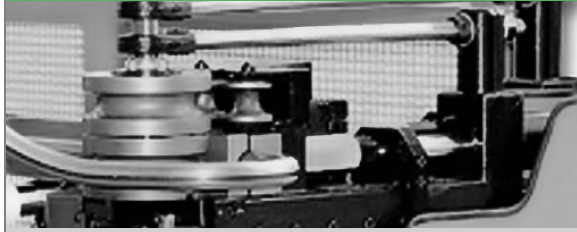
PROVAR 5 U-D