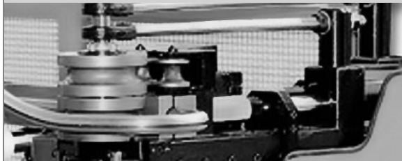
PROVAR 5 U-D