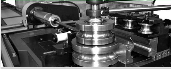
PROVAR 5 U-D