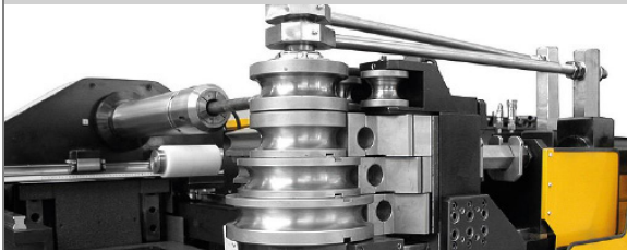
PROVAR 6 U-D